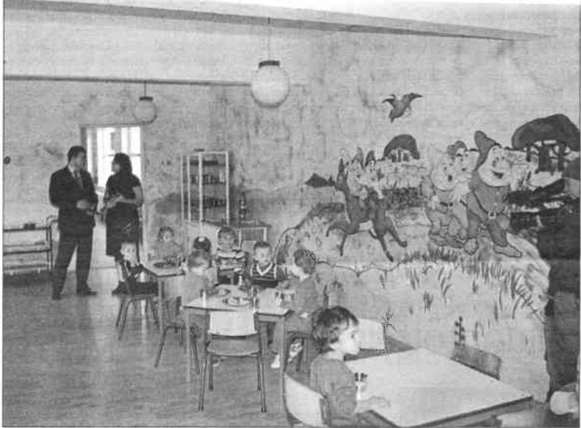
Üzsonnázó gyerekek a balánbányai Havasi Gyopár napköziben. Újra megfelelő körülmények között