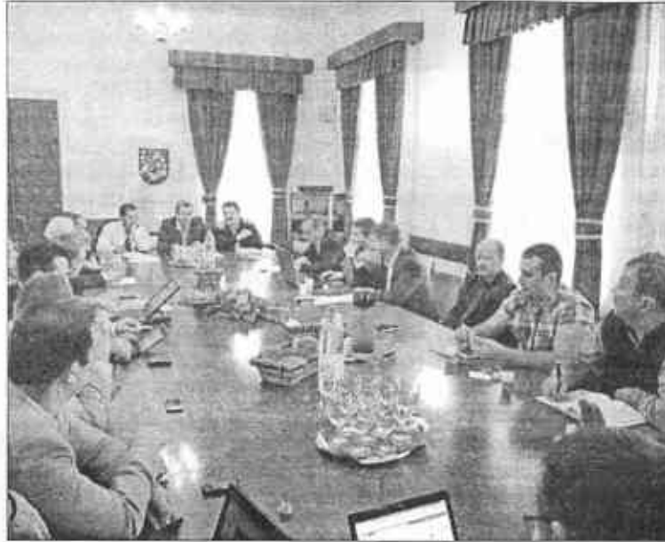
Költségvetés-módosításról egyeztettek. Maratoni napirendi pont FOTÓ MÁTHÉ LÁSZLÓ FERENC

A polgármester előterjesztése szerint nagyjából félmillió eurónyi összeget kellett befoglalni, illetve átcsoportosítani a költségvetés-