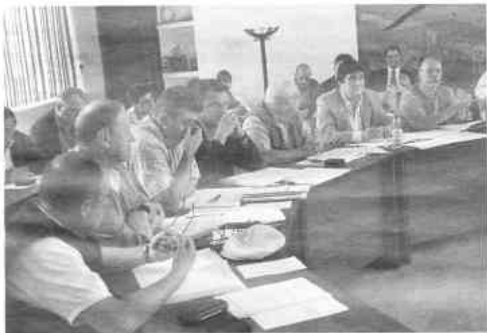
||| Maratoni ülés után népszavazást írnak ki

A határozat értelmében a népszavazásra 2012. március 11-én kerülne sor.