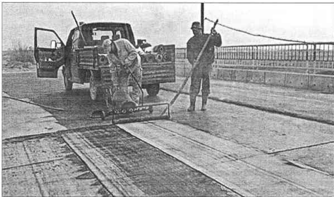
Új aszfaltszőnyegterítő utáspáros Alcsíkon. Szakaszos haladás

Gőzerővel dolgoznak az utászok a 123A jelzésű megyei úton Csíkszentkirály–Nagytusnád között: egyes szakaszok már elkészültek, máshol pedig a hidakkal, átereszekkel, szegélyező sáncokkal dolgoznak a kivitelező cég munkásai. Az elkészült szakaszok minőségével azonban nem mindenki elégedett.